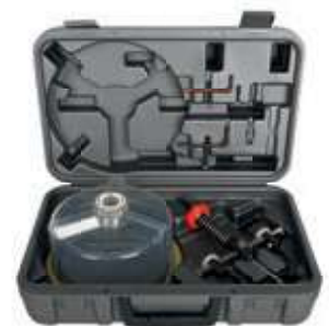
Abb. zeigt FKS-X 48-150